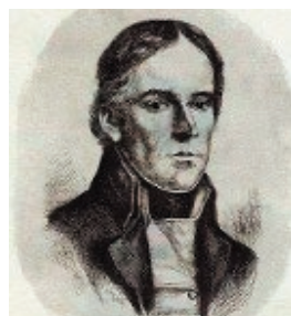
František Ondřej Poupě

151. výročí narození významného brněnského architekta a teoretika, představitele evropské architektonické avantgardy. Architekt, návrhář interiérů a nábytku, esejista: od roku 1897 intenzivně publikoval, hlavně polemicko-satirické články o vídeňské secesi, vystupoval jako teoretik a realizátor puristicko-funkcionalistického pojetí architektury, oproštěné od zbytečné zdobnosti a ornamentu, které nesnášel. Mezi jeho nejslavnější stavby a rekonstrukce patří rekonstrukce vídeňské kavárny Museum (1899), které se pak pro její lineární vzhled a absenci zdobných prvků říkalo „kavárna Nihilismus “, Steinerova vila (1910), Scheuova vila (1912 první terasový dům postavený v Evropě). V roce 1912 Loos založil a řídil soukromou školu architektury, na níž studovali převážně cizinci. Kavárna Café Museum , Vídeň (1899), obchodní dům Goldmann a Salatsch , Vídeň (1910–1911), Bauerova vila a cukrovar , Hrušovany u Brna (1916–1917), interiér Bauerova zámečku , Brno-Výstaviště (1924–1925), Müllerova vila , Praha /dnes památka UNESCO/) (1928–1930) či návrh na nástavbu nájemného domu H. Jordana , Brno, Sedláková ulice (1931).